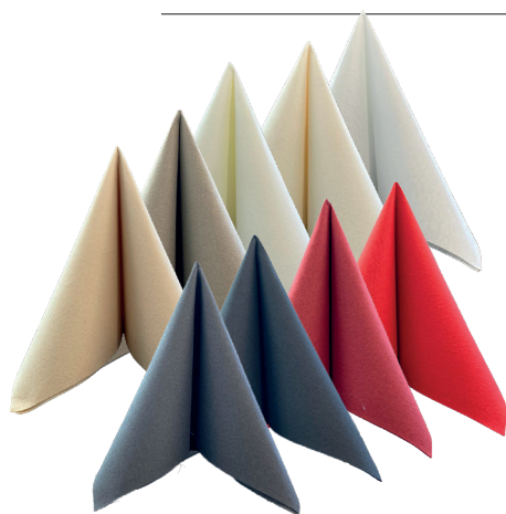
Codes 013310 à 013324 - 40x40 cm

Résistance exceptionnelle Agréable au toucher Hygiénique et sain