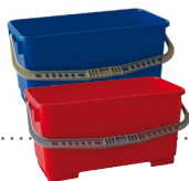
SEAUX 22 L