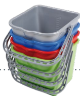
SEAUX 15 L - 25 L