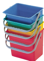
SEAUX 6 L - 9 L